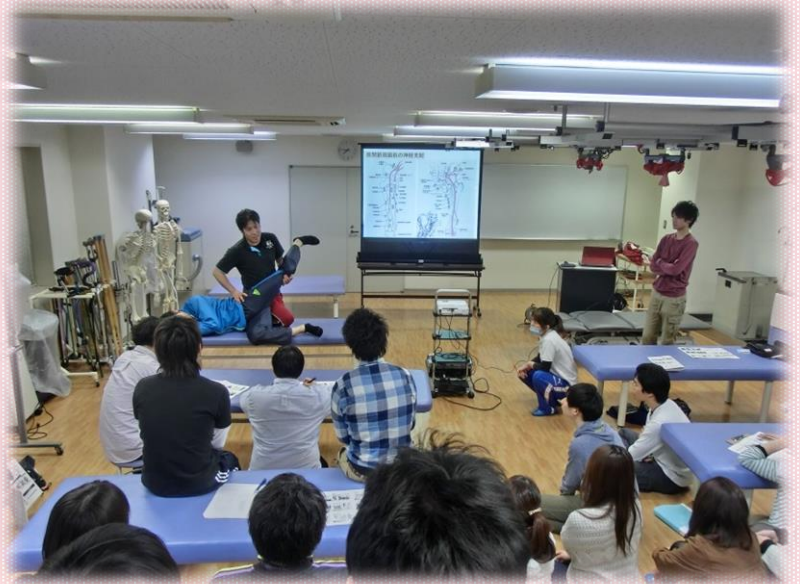
※「巧人」の勉強会風景

長年、理学療法士をしているなかで感じることは「気力の源は体力なり！」という事です。「心を治す」ということは、結果的に達成できたとしても、治療戦略としては難しいと感じていましたが、体力を向上させるための戦略は、様々な方法があり、具体的に取り組めるからです。自分が目指す「巧い理学療法士」になるために同志を集めて「巧人」というグループを作り、コロナ禍前は毎月勉強会を開き、切磋琢磨していました。この勉強会では機能解剖を理解し、みんなが少しでも巧く治療ができるようになることを目標に取り組んできたことで、自分自身が「巧い理学療法士」に大きく近づけたと確信しています。「巧人」の理念・思想は1. 人の心と体を理解し、解釈するべし、2. 人の心と体は摩訶不思議と心得るべし、3. 己の感性を研ぎ澄ませるべし、4. 人の心と体に不変はありえず常に変容を求め続けるべし、5. 巧い技と大きな人間力を備え同志と共に鍛えるべしとしています。このように、自分が目指す理学療法士像を「言葉」にすること、同じ目標を持った同志がいることで、より具体的に「自分」と向き合うことができるようになりました。皆さんも、自分の理学療法士人生に納得がいくように、時々、言葉にして「自分」と向き合ってみてください。