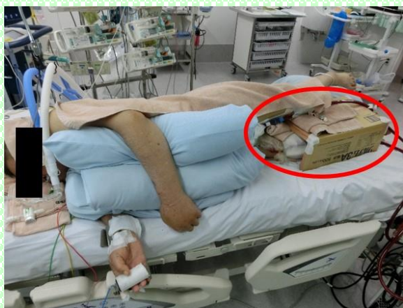
足架台 患者さん使用時 5

最後に、今回の発表にあたりご協力くださった患者様をはじめ、日頃からご指導くださった皆様にもこの場をお借りして深く御礼申し上げます。