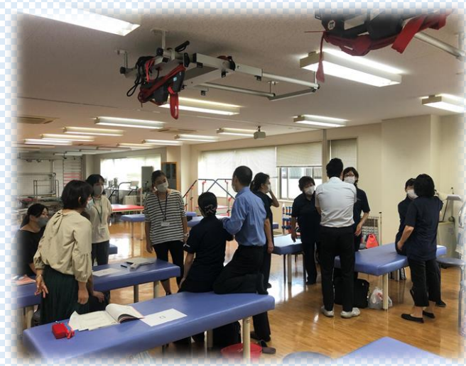
介護支援専門員資質向上事業での研修会風景