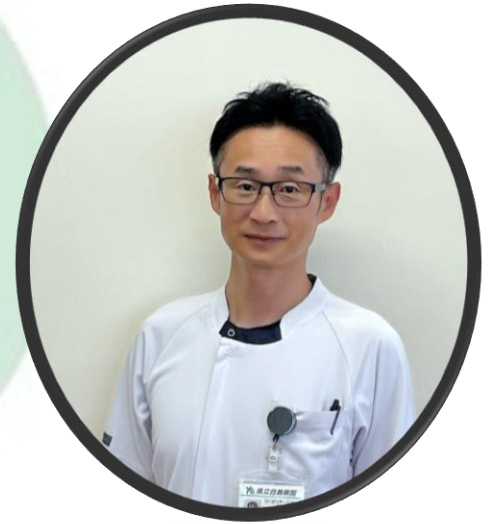
香川県理学療法士会

我々の進む道が不透明であるからこそ、自分自身の考えを明確にしておくことで時代の流れに対応し、自分の存在価値を輝かせ、向かうべき道を見つけることができるのではないのでしょうか。偉そうなことを述べましたが、私は新人の頃から考えを持って行動していたわけではなく、理学療法士は存在するだけで希少価値があり、能力がなくても重宝された時代です。この30年間で状況は様変わりし、存在するだけでは時代に取り残されるかもしれません。過去を振り返り、未来のあるべき姿（ビジョン）を見据えて、今何をするのかを考えてみて下さい。